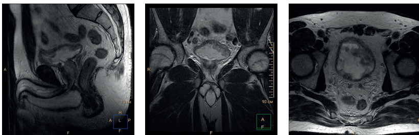
Рис. 1. На серии томограмм малого таза в режимах T2 и T2 в режиме Stir в сагиттальной, коронарной и аксиальной проекциях определяется диффузное опухолевое поражение мочевого пузыря, стенка с признаками инвазии мышечного слоя. Регионарные лимфатические узлы без признаков поражения