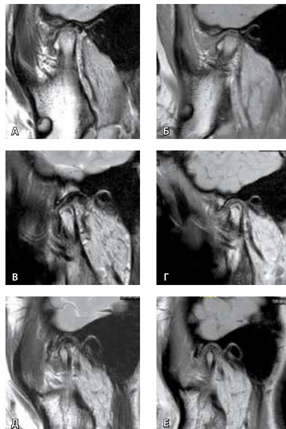
Рис. 1. Причины суставного шума после операции: А, Б – малая длина и гиперкоррекция диска; В, Г – сепарация диска и мышелка; Д, Е – остеофит мышелка ( А, В, Д – в положении с закрытым ртом; Б, Г, Е – в положении с открытым ртом)

Оценка положения диска с помощью МРТ и процент успеха операции отражены в табл. 5. Через 12 месяцев после операции