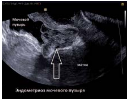
Рис. 9. В проекции задней стенки мочевого пузыря визуализируется растущее в просвет пузыря солидно-кистозное образование средней эхогенности, неправильной формы с четкими неровными контурами, в структуре его несколько кистозных полостей 2–6 мм. Трансвагинальное сканирование