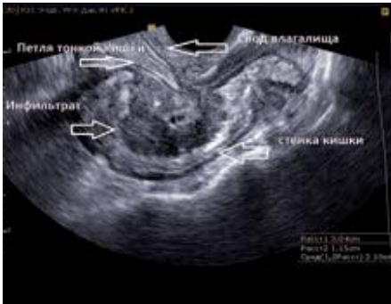
Рис. 8. Вовлечение в инфильтративный процесс ректо-сигмоидного отдела толстой кишки с прорастанием мышечного слоя кишки. Калипером указан эндометриоидный инфильтрат. Трансвагинальное сканирование