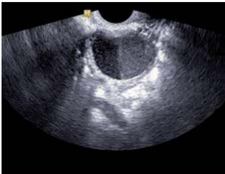
Рис. 2. Эндометриодная киста яичника, определяется симптом «кофейного зерна». Трансвагинальное сканирование