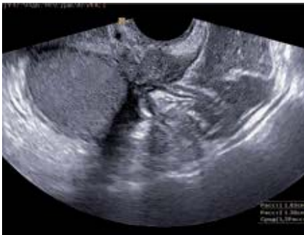
Рис. 5. Эндометриоидный инфильтрат крестцово-маточной связки овоидной формы в сочетании с эндометриоидной кистой яичника. Трансвагинальное сканирование