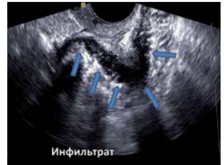
Рис. 4. Эндометриодный инфильтрат заднего свода влагалища в форме ладьи. Трансвагинальное сканирование

В подгруппе 2б односторонние кисты были у 75% больных, двусторонние – у 25%. Размеры кист варьировали в широких пределах – от 5 до 14 см, в большинстве случаев (94%) они составляли в диаметре 3,5–7 см. Толщина стенок кист была от 2 до 5 мм. Содержимое кист яичника характеризовалось различным уровнем эхогенности. Так, эндометриодные кисты в виде полностью анэхогенных образований были выявлены в 3% наблюдений. Пониженная эхогенность образования визуализировалась в 60% наблюдений, повышенная – в 20%, средняя – в 17%.