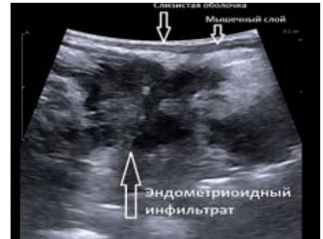
Рис. 7. Микроконвексный высокочастотный датчик в полости прямой кишки. Определяется прорастание эндометриоидного инфильтрата до серозного слоя прямой кишки. Интраоперационная фотография

неоднородность внутренней структуры образования. На фоне гипоэхогенных участков неправильной формы выявлялись зоны повышенной эхогенности и наоборот. В некоторых наблюдениях в структуре образования определялись отдельные небольшие гиперэхогенные включения. В единичных случаях были выявлены кистозные полости до 5 мм (рис. 6).