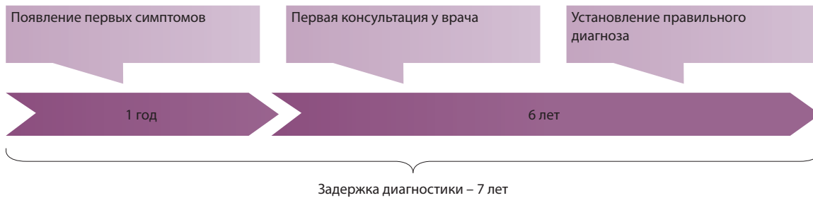
Рис. 1. Поздняя диагностика эндометриоза

введенным в брюшную полость или просвет прямой кишки.