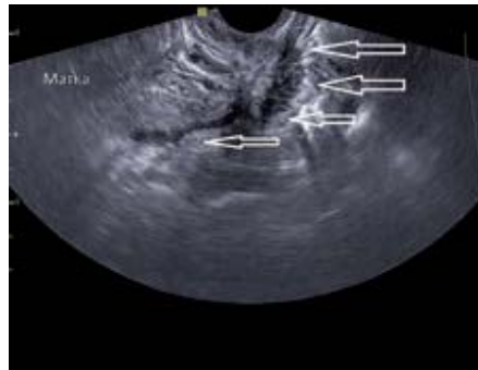
Рис. 6. «Ползущий» эндометриоидный инфильтрат ретроцервикальной области. Стрелками указана облитерация позадидматочного пространства эндометриоидным инфильтратом. Трансвагинальное сканирование