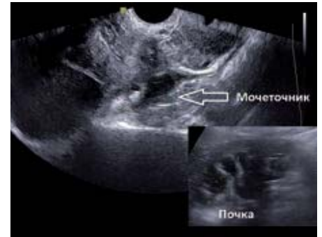
Рис. 10. Расширение нижней трети мочеточника на уровне эндометриоидного инфильтрата. Справа внизу ипсилатеральная почка: определяется каликопиелозктазия. Трансвагинальное сканирование

этих пациенток был диагностирован аденомиоз I стадии, двум – аденомиоз II стадии. Основной жалобой пациенток была гематурия в период менструации. Во всех случаях при УЗИ вагинальным датчиком в просвете мочевого пузыря были выявлены солидно-кистозные опухоли размерами до 3 см с ростом в просвет мочевого пузыря из задней стенки с признаками плотного сращения задней стенки пузыря с передней стенкой матки. По данным доплерометрии, кровотоков характеризовался как неспецифический низкоскоростной высокорезистентный. Диагноз был подтвержден при цистоскопии, биопсии образований (рис. 9).