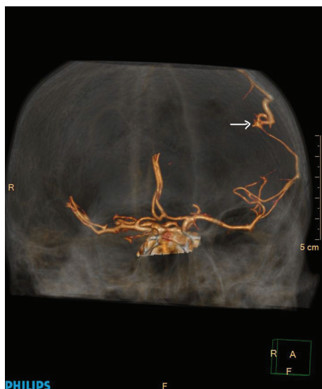
Рис. 2. КТ-ангиография: 3D-реконструкция. АВМ (стрелка) кровоснабжается из ветвей левой СМА, отток из АВМ осуществляется в систему поверхностных вен левой теменной области

наведения. С помощью 3DRA-наведения в афферентную артерию заведен проводник 0,01 дюйма, затем микрокатетер, через который суперселективно введена смесь Б-бутилакрилата и липидола. При контроле контрастирования АВМ не отмечено, преждевременного артериовенозного сброса не получено (рис. 3). Во время операции было использовано 50 мл рентгеноконтрастного вещества (ультравист 370).