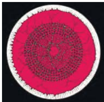
Рис. 2. Схема панретиальной лазерной коагуляции