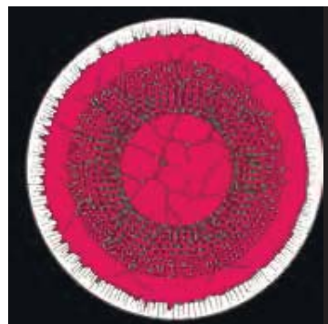
Рис. 3. Схема панретиальной лазерной коагуляции в сочетании с лазерной коагуляцией по типу «решетки»

Рейчелу – Майнстеру. Применяли три основных метода коагуляции: панретиальную лазерную коагуляцию сетчатки, фокальную лазерную коагуляцию, лазерную коагуляцию по типу «решетки».