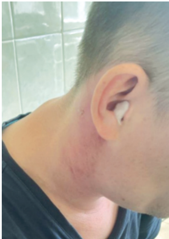
Рис. 1. Инфильтрат по переднебоковой поверхности шеи справа