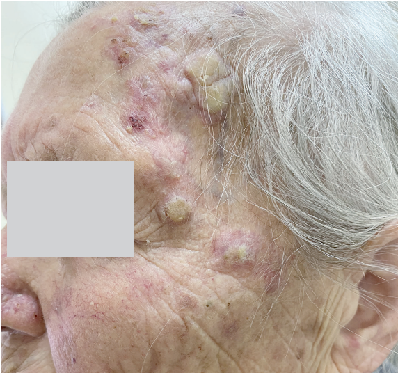
Рис. 4. Левая боковая поверхность лица – множественный актинический кератоз, кератотическая форма

Пациентке выполнено ультразвуковое исследование кожи лица и дерматоскопия (DUB SkinScanner, TRM (Германия), 75 МГц).