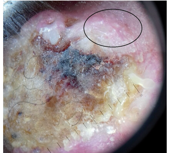
Рис. 5. Дерматоскопия плоскоклеточного рака кожи кончика носа, овалом обозначены белые точки и круги

Дерматоскопическое исследование очагов актинического кератоза левой скуловой области: визуализируются эритематозные очаги розовато-красного цвета с толстыми чешуе-корками, множественные извитые сосуды. В области кончика носа визуализируется эндодифтно-язвенное образование, покрытое толстой глубокой плотной серозно-геморрагической коркой с прилипшими волокнами (рис. 5). Периферический валик опухоли розовато-бурого цвета с неровными подрывными краями и множественными полиморфными сосудами. В области опухоли визуализируются белые точки и круги. В центральной части красной каймы нижней губы наблюдается кератиновая корка серовато-желтого цвета с белыми бесструктурными зонами и изъязвлением по периферии, множественные полиморфные сосуды. Заключение: дерматоскопическая картина соответствует кератотической форме актинического кератоза, выявлены признаки язвенной