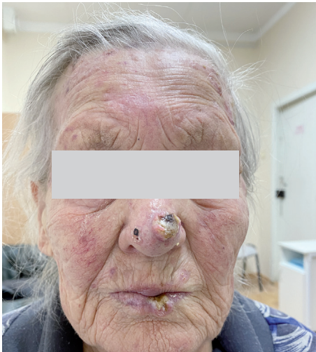
Рис. 1. Актинический кератоз кожи лица с признаками хронического фотоповреждения