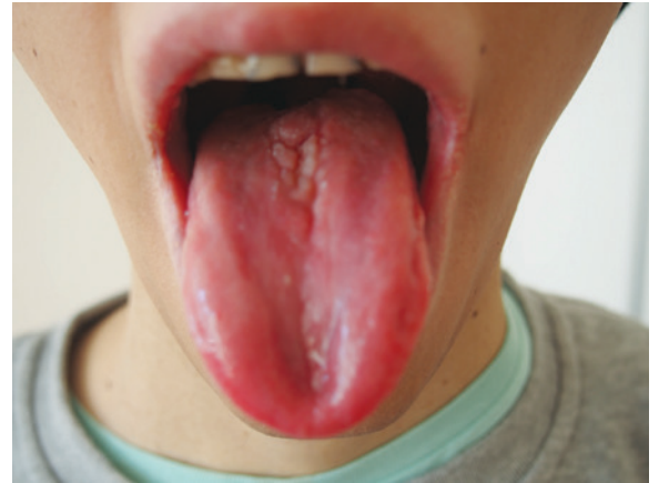
Рис. 1. Кандидоз полости рта

В 8 лет впервые выявлено незначительное повышение тиреотропного гормона (ТТГ), при этом уровень свободного тироксина (св. Т4) был в пределах